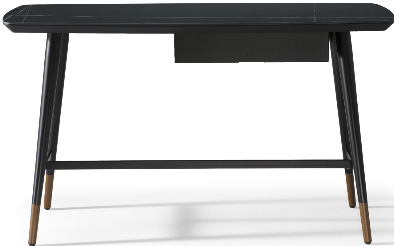
■ G22603X / G22605X