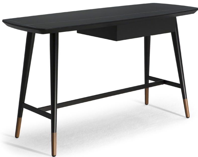
■ G22603X / G22605X