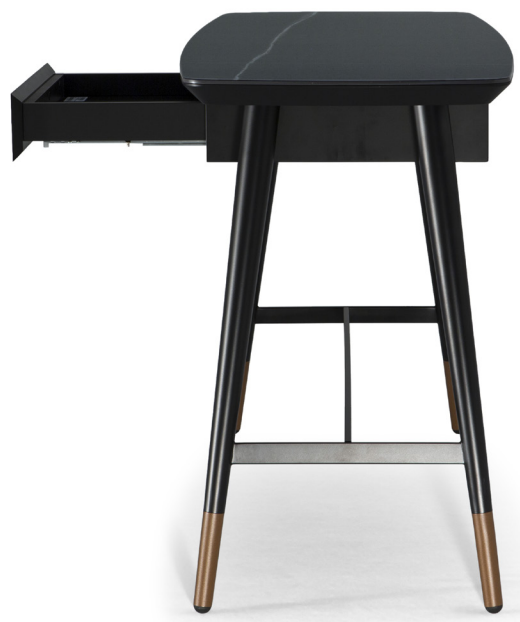
■ G22603X / G22605X

VŠECHNY UVEDENÉ OBRÁZKY JSOU POUZE PRO ILLUSTRACNÍ ÚČELY. SKUTEČNÝ PRODUKT SE MŮŽE LIŠIT DŮVODEM VYLEPŠENÍ PRODUKTU.