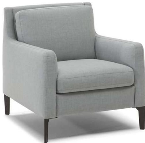
■ Vers. 233