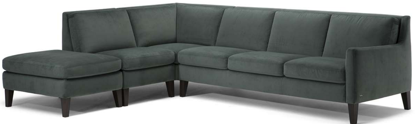
■ Vers. 100+001+011+019