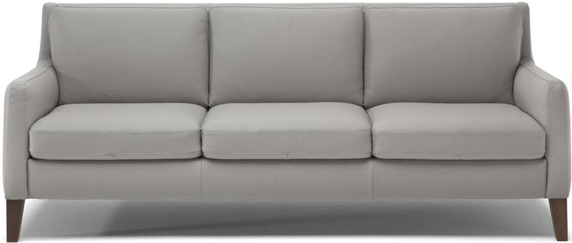
■ Vers. 064